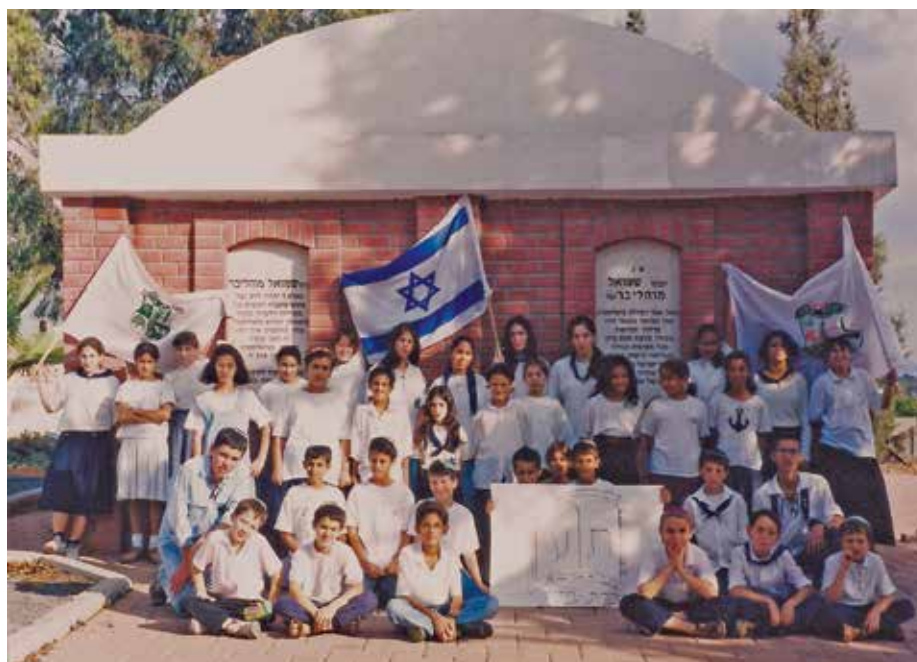
חניכי המחזור הראשון של "בני עקיבא" במזכרת בתיה, כסלו ה'תשנ"ה.

הרב שמואל מוהליבר נפטר ב"ט בסיון ה'תרנ"ח ונקבר בביאליסטוק ועל קברו הוקם "אוהל" אשר נותץ במהלך השואה. בכסלו ה'תשנ"ב הועלו עצמותיו לארץ ישראל ונטמנו במזכרת בתיה ועל קברו הוקם "אוהל" בדומה ל"אוהל" שהיה בביאליסטוק