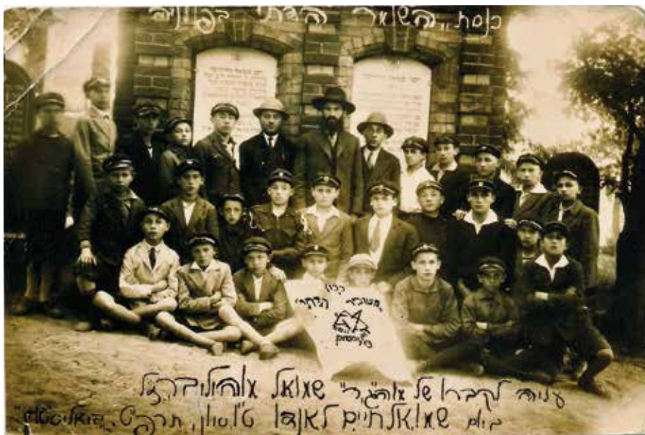
חניכי "השומר הדתי" בביאליסטוק ה'תרפ"ט (1929) על רקע "אוהל" הרב מוהליבר TM804775

הרב שמואל מוהליבר נפטר ב"ט בסיון ה'תרנ"ח ונקבר בביאליסטוק ועל קברו הוקם "אוהל" אשר נותץ במהלך השואה. בכסלו ה'תשנ"ב הועלו עצמותיו לארץ ישראל ונטמנו במזכרת בתיה ועל קברו הוקם "אוהל" בדומה ל"אוהל" שהיה בביאליסטוק